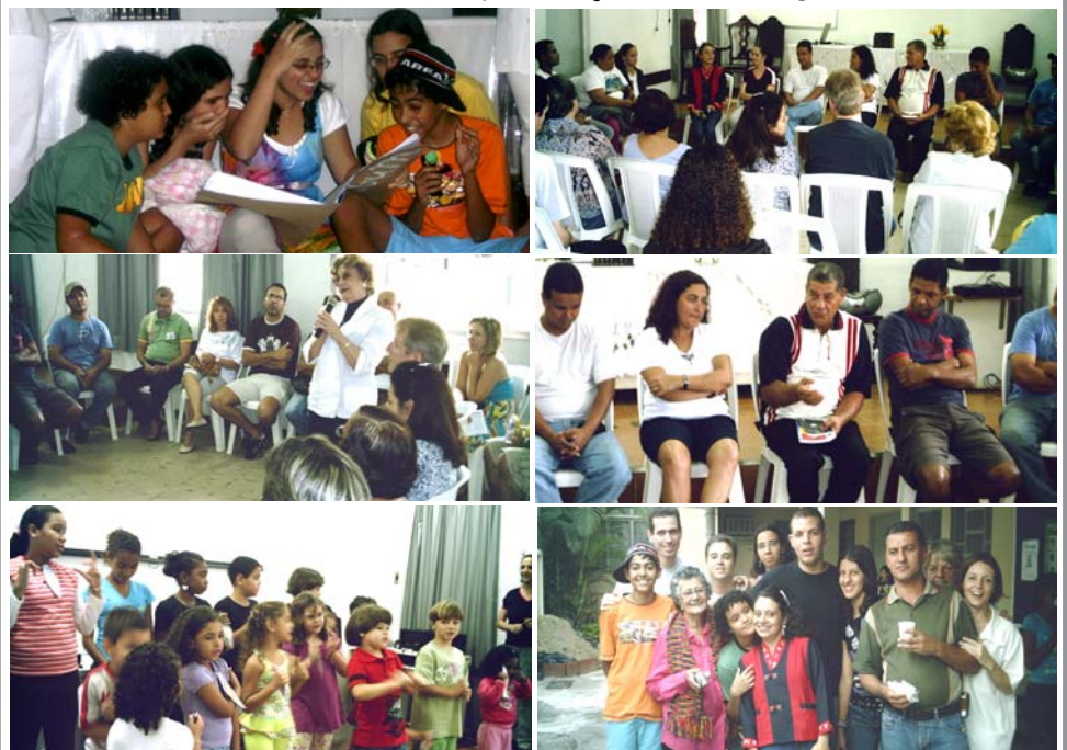
Homenagem do DIJ/CELV aos papais, em agosto. Teve teatro, música, confraternização com muita alegria!

RÁDIO RIO DE JANEIRO 37 Anos Divulgando o Espiritismo